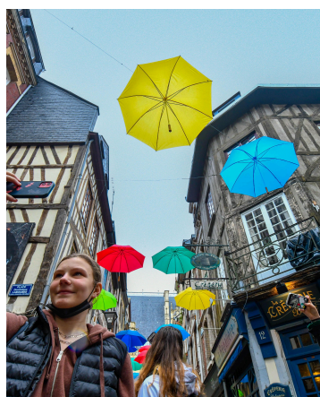
Les parapluies sont un symbole de la Normandie et pourtant...

Pour déterminer un top 30 des villes de plus de 50 000 habitants dans lesquelles le parapluie est indispensable, les précipitations quotidiennes et le nombre moyen de jours de pluie par mois ont été compilés et voici ce que révèle ce classement. C'est à Grenoble (Auvergne-Rhône-Alpes) que revient le titre de la ville